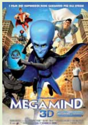
>> Megamind giovedì 30 giugno 2011