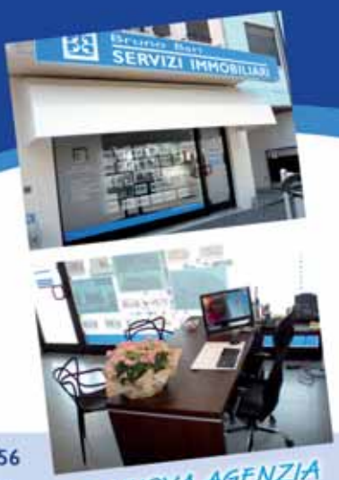
La NUOVA AGENZIA in Roveredo in Piano

BRUNO BARI SERVIZI IMMOBILIARI - Tel. 0434 960428 - Fax 0434 960556 Piazza Roma, 23 - 33080 ROVEREDO IN PIANO (PN) - roveredo@brunobari.com