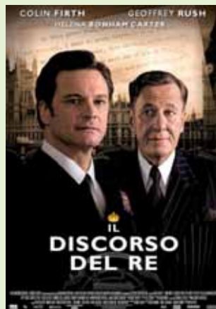
>> Il discorso del re mercoledì 15 giugno 2011