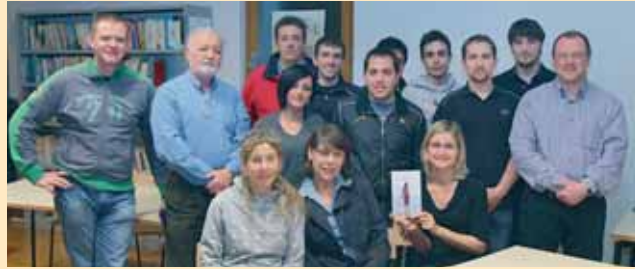
>> La Commissione Biblioteca incontra i giovani dell'Avis

Negli ultimi mesi la Commissione Biblioteca, insieme all'Assessore di riferimento Igor