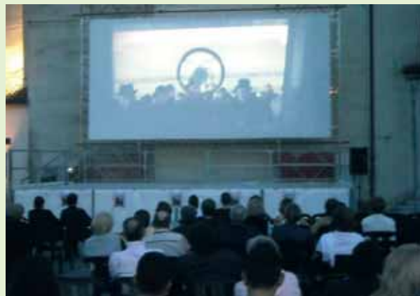
>> Proiezione del Film Il discorso del Re